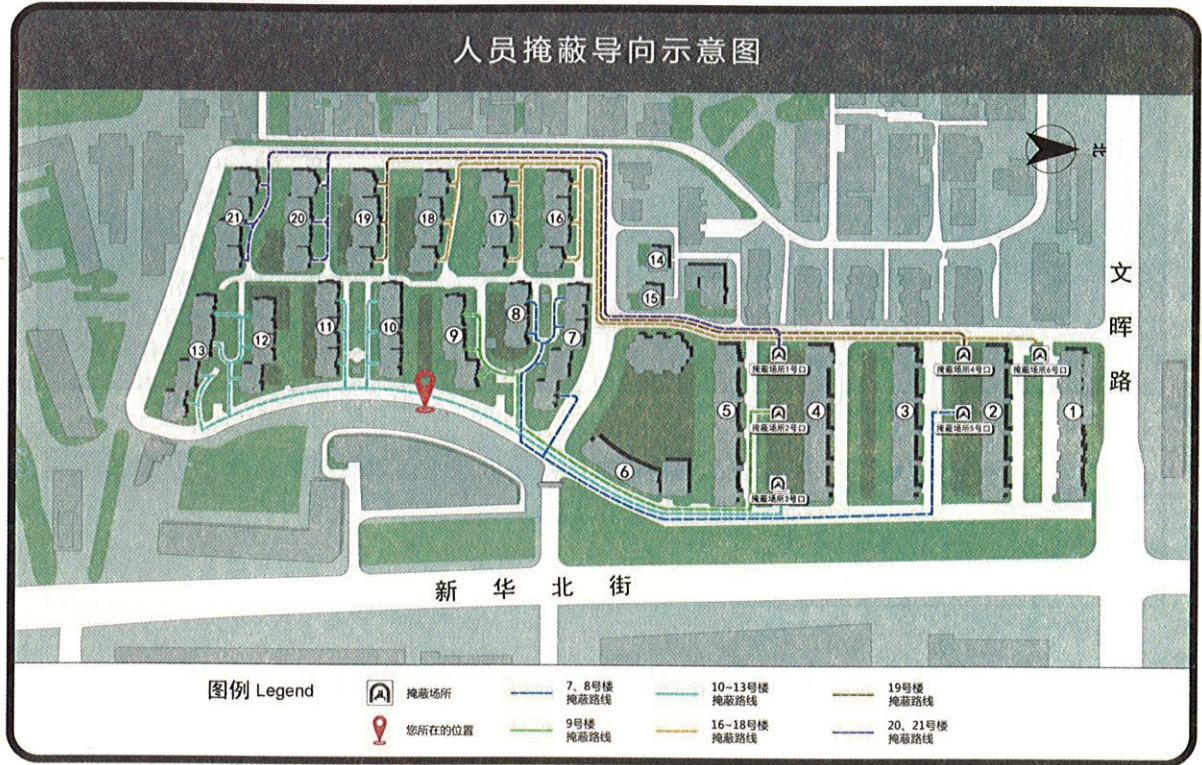
图 A.1 地面上设置的人员掩蔽导向示意图示例