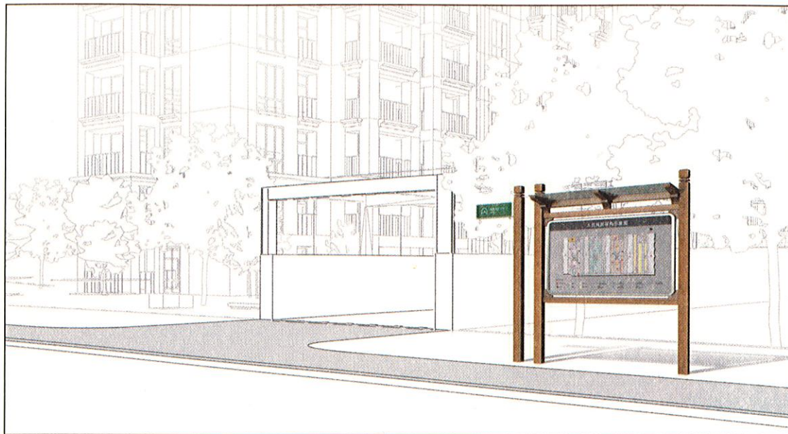
图 B.1 人员掩蔽工程入口处设置的位置标志和人员掩蔽导向示意图示例