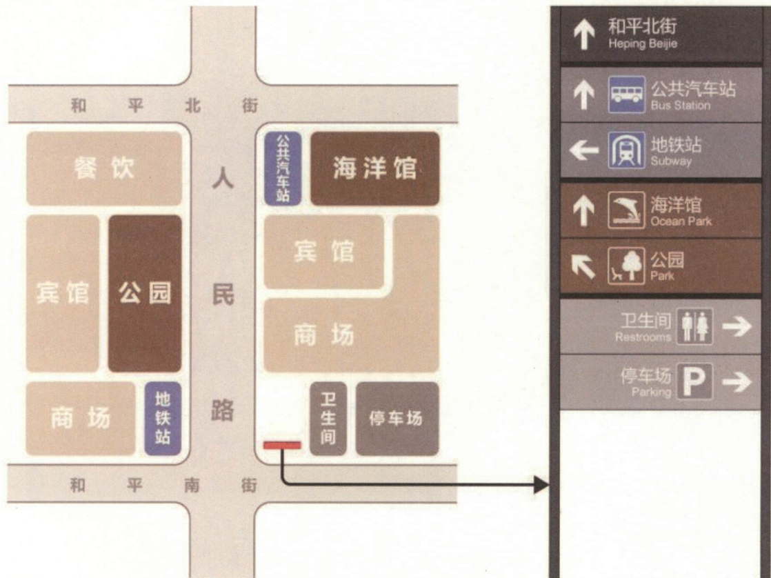
图 A.1 以旅游为特色的城市导向信息设置示例