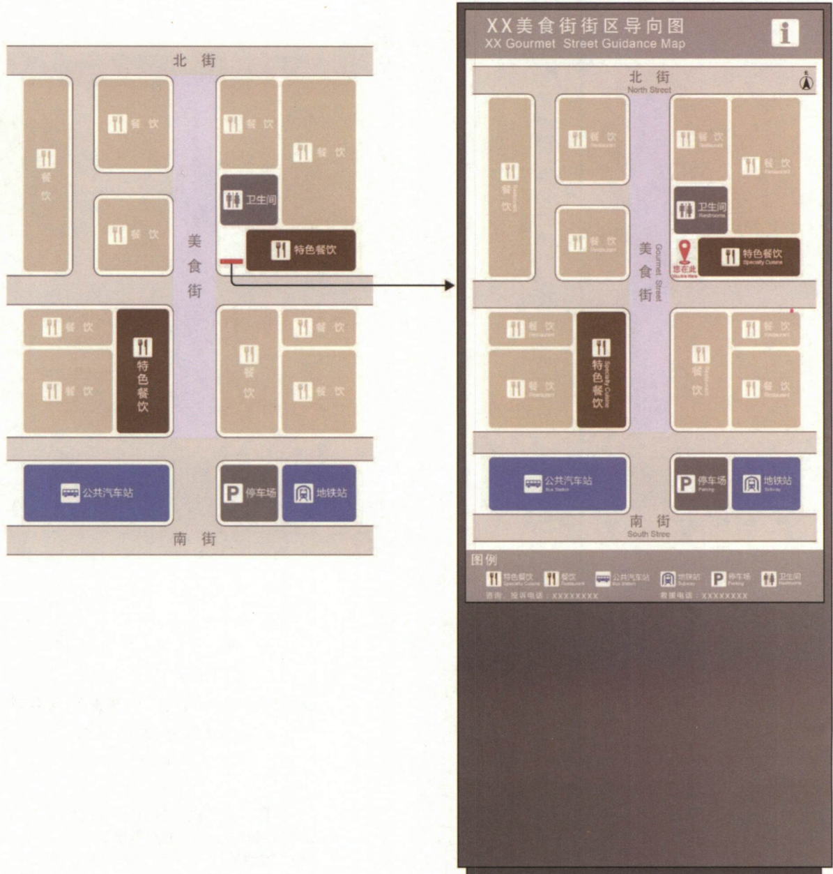
图 A.2 特色街区的街区导向图设置示例